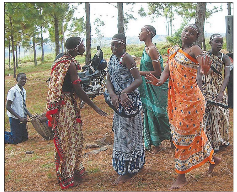
Beim Kulturnachmittag haben die Afrikaner Tänze aufgeführt. Auch die Deutschen haben gezeigt, was sie zu bieten haben.