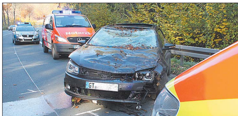
Die 24-jährige Fahrerin dieses VW Eos wurde gestern Vormittag bei einem Alleinunfall auf der Bielefelder Straße verletzt.

Werther (WB). Eine entlaufene Jungkatze ist am Samstag in einem Waldstück am Schwarzen Weg gefunden worden. Das Tier hat einen weißen Latz und weiße Pfoten. Wer die Katze vermisst, kann sich im Einwohnerservice unter ☎ 0 52 03/705-44 oder -45 melden.