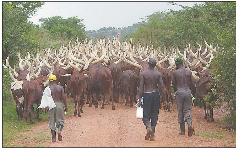
Ein Stau der etwas anderen Art: Einheimische Landwirte treiben auf der Straße eine Herde Ankola-Rinder vor sich her.

... und geht mit seinem Hund auf dem Blotenberg spazieren. Die Herbstsonne ist an diesem frühen Nachmittag nicht nur wunderbar wärmend, sondern taucht die umliegenden Bäume auch in ein ganz besonderes Licht. Überall am Wegesrand leuchtet es rot, gelb und gold. Ein ganz besonderer Ausblick, findet... EINER