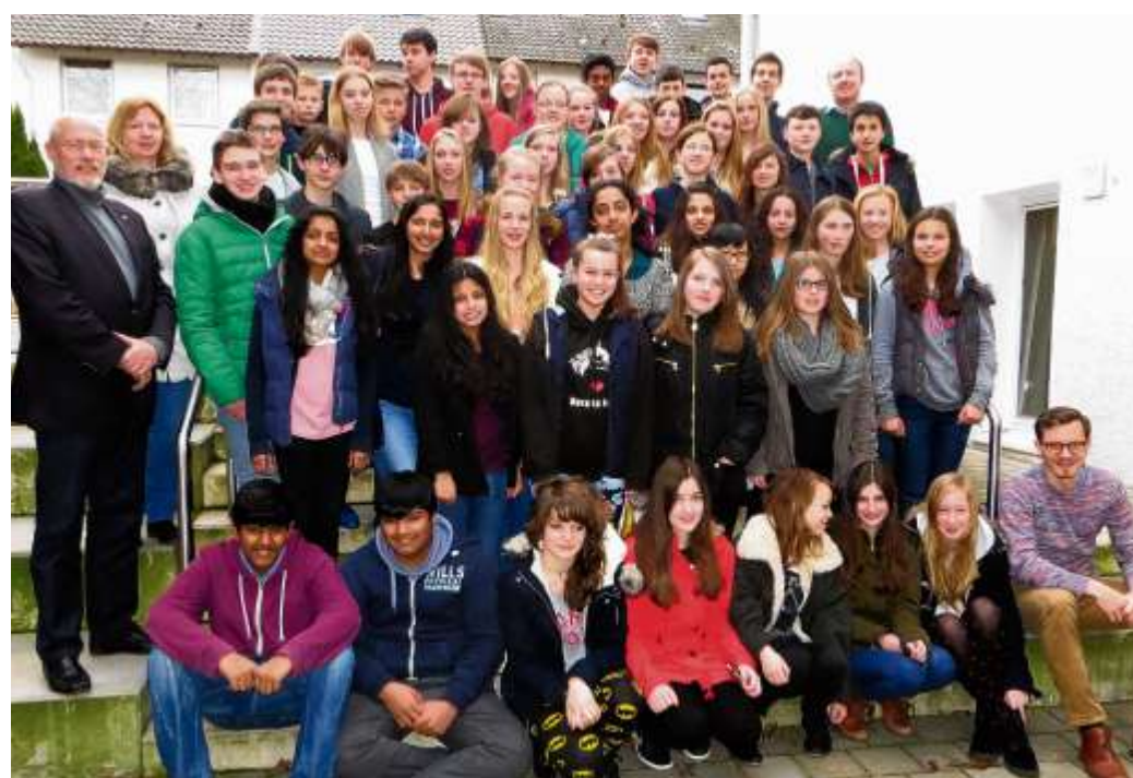
Gäste und Gastgeber: Über den Besuch von Jugendlichen der englischen Partnerschule aus Yarm freute sich jetzt das Evangelische Gymnasium in Werther.