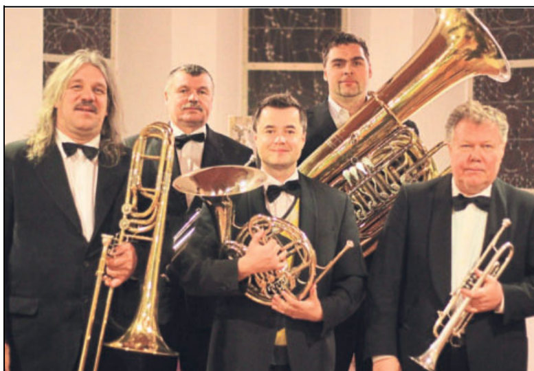
Der Besuch der Bläser aus Riga ist seit vielen Jahren eine beliebte Tradition in Werther. Am 19. Dezember musizieren sie in Rotenhagen.

Werther-Rotenhagen (WB). Die Bethlehemsgemeinde Rotenhagen lädt ein zum Konzert des Rigaer Bläserquintetts am Samstag, 19. Dezember, 19 Uhr in der Bethlehemskirche (Nordholz 9). Der Eintritt ist frei, um eine Spende wird gebeten. Denn das Quintett rekrutiert sich aus den Blechbläsern der Rigaer Philharmoniker, die sich in der Adventszeit in Deutschland ein Zubrot verdienen möchten. Wie im letzten Jahr sind sie im Wertheraner Raum unterwegs und stellen ihre virtuoseren Künste unter Beweis. Die Riga-Bläser überzeugen durch qualitativ hochwertige Bläsermusik aus den verschiedensten Epochen. Von Mozarts kleiner Nachtmusik über Adventschoräle zum Mitsingen bis hin zu modernen Arrangements wie »Jingle Bells«.