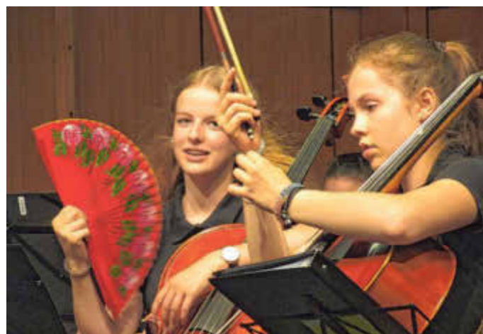
Ganz schön heiß: Am wärmsten Tag des Jahres präsentierten die Musikerinnen und Musiker den ersten Teil ihres Konzerts.

Chor der sechsten Klassen. Ein halber Chor, gewissermaßen. Denn nur zwei der insgesamt vier Klassen waren je Konzertabend zu hören und sehen. Doch ob »Waterloo« oder »Love my Life« – die Schülerinnen und Schüler durften sich in Applaus sonnen und baden. Und das passte vor allem am Donnerstagabend gut.